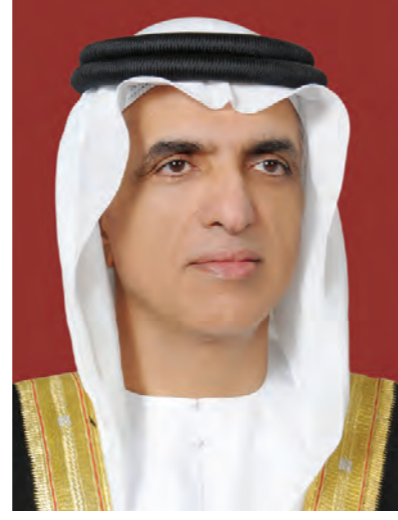
صاحب السمو الشيخ سعود بن مقر القاسمي عضو المجلس الأعلى للاتحاد حاكم إمارة رأس الخيمة