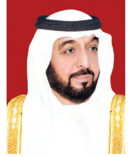
صاحب السمو الشيخ خليفة بن زايد آل نهيان رئيس دولة الإمارات العربية المتحدة حاكم إمارة أبوظبي