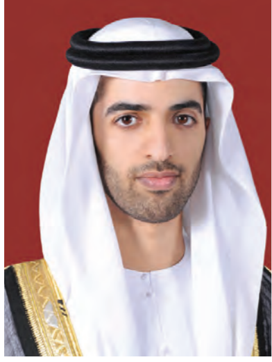
صاحب السمو الشيخ محمد بن سعود بن مقر القاسمي ولي عهد إمارة رأس الخيمة