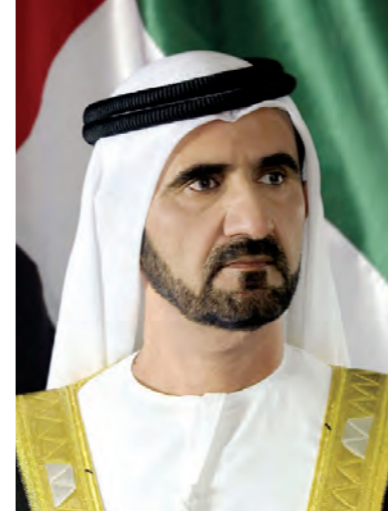
صاحب السمو الشيخ محمد بن راشد آل مكتوم نائب رئيس الدولة رئيس مجلس الوزراء حاكم دبي