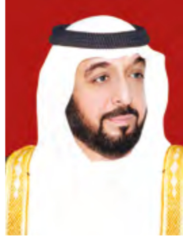
صاحب السمو الشيخ خليفة بن زايد آل نهيان رئيس دولة الإمارات العربية المتحدة حاكم أبوظبي