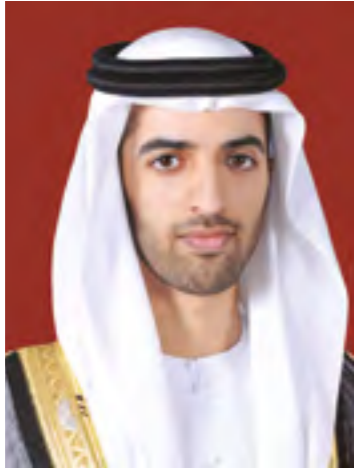
صاحب السمو الشيخ محمد بن سعود بن مقر القاسمي ولي عهد رأس الخيمة