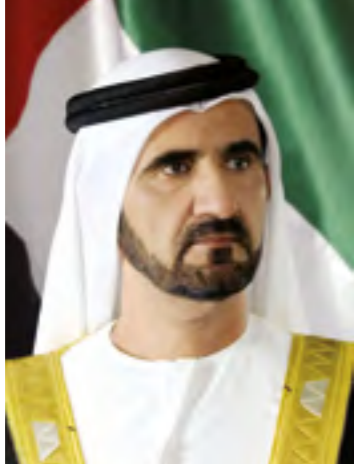
صاحب السمو الشيخ محمد بن راشد آل مكتوم نائب رئيس الدولة رئيس مجلس الوزراء حاكم دبي