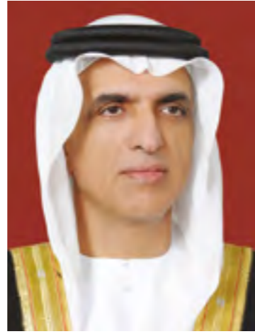
صاحب السمو الشيخ سعود بن مقر القاسمي عضو المجلس الأعلى للاتحاد حاكم رأس الخيمة